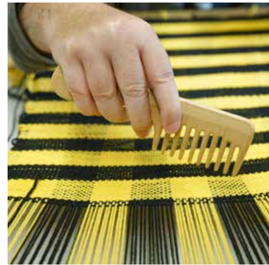
Mit Pinsel, Schere und Kamm: Die Arbeiten in den verschiedenen Ateliers sind so vielfältig wie die Materialien.