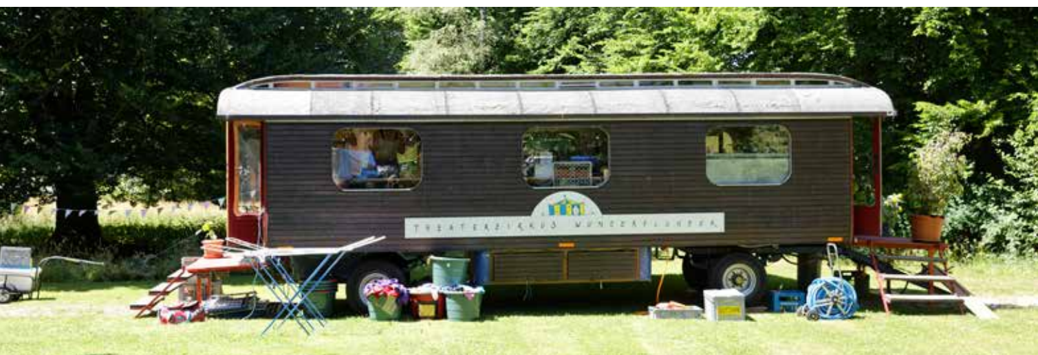
Der Zirkustross traf bereits am Samstag mit Traktor und Wagen in Köniz ein und beim anschließenden Aufstellen des Zirkuszeltes werden alle Hände gebraucht.