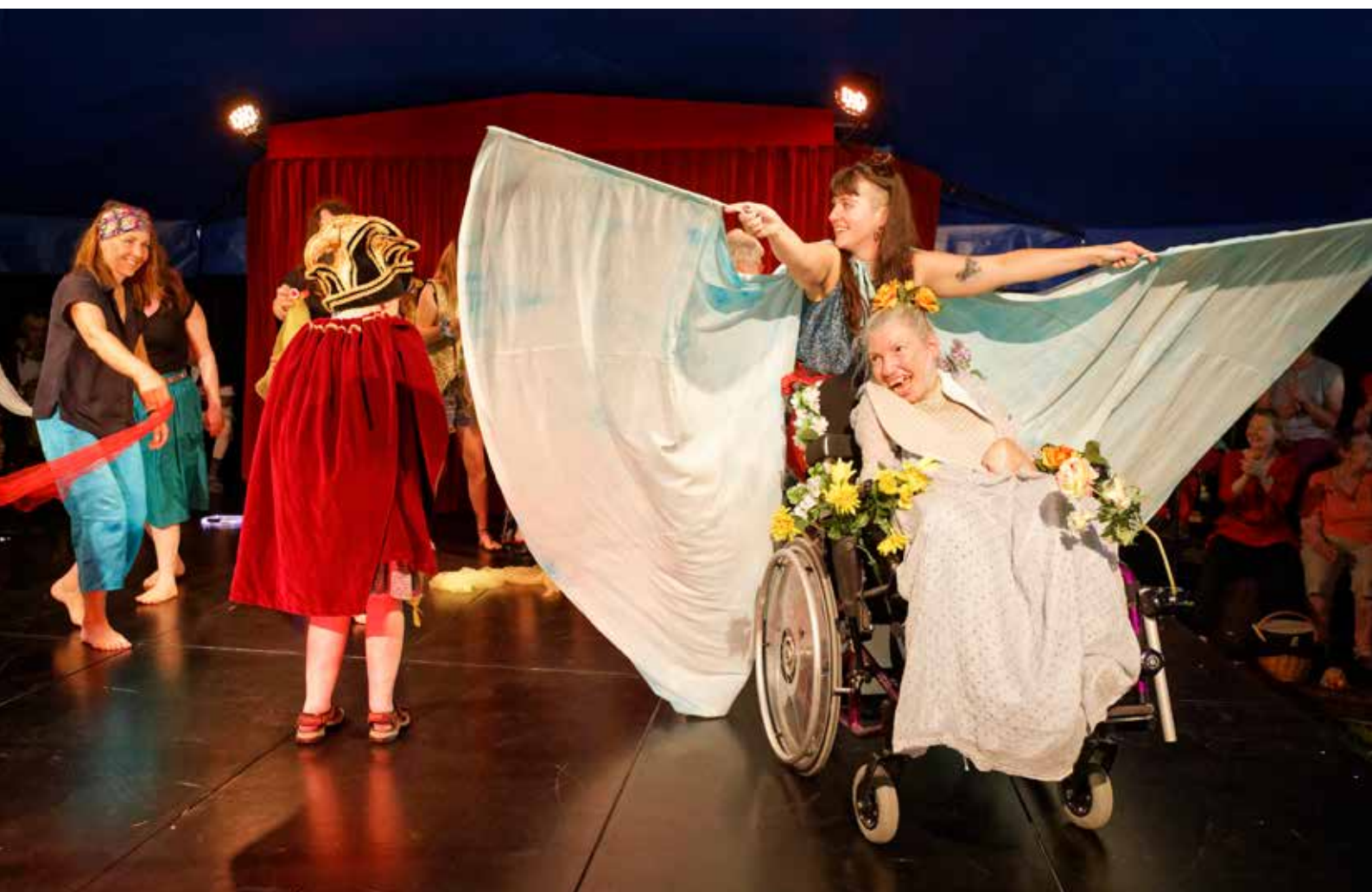
Der grosse Auftritt im Zirkuszelt war aufregend, die Freude um so grösser.