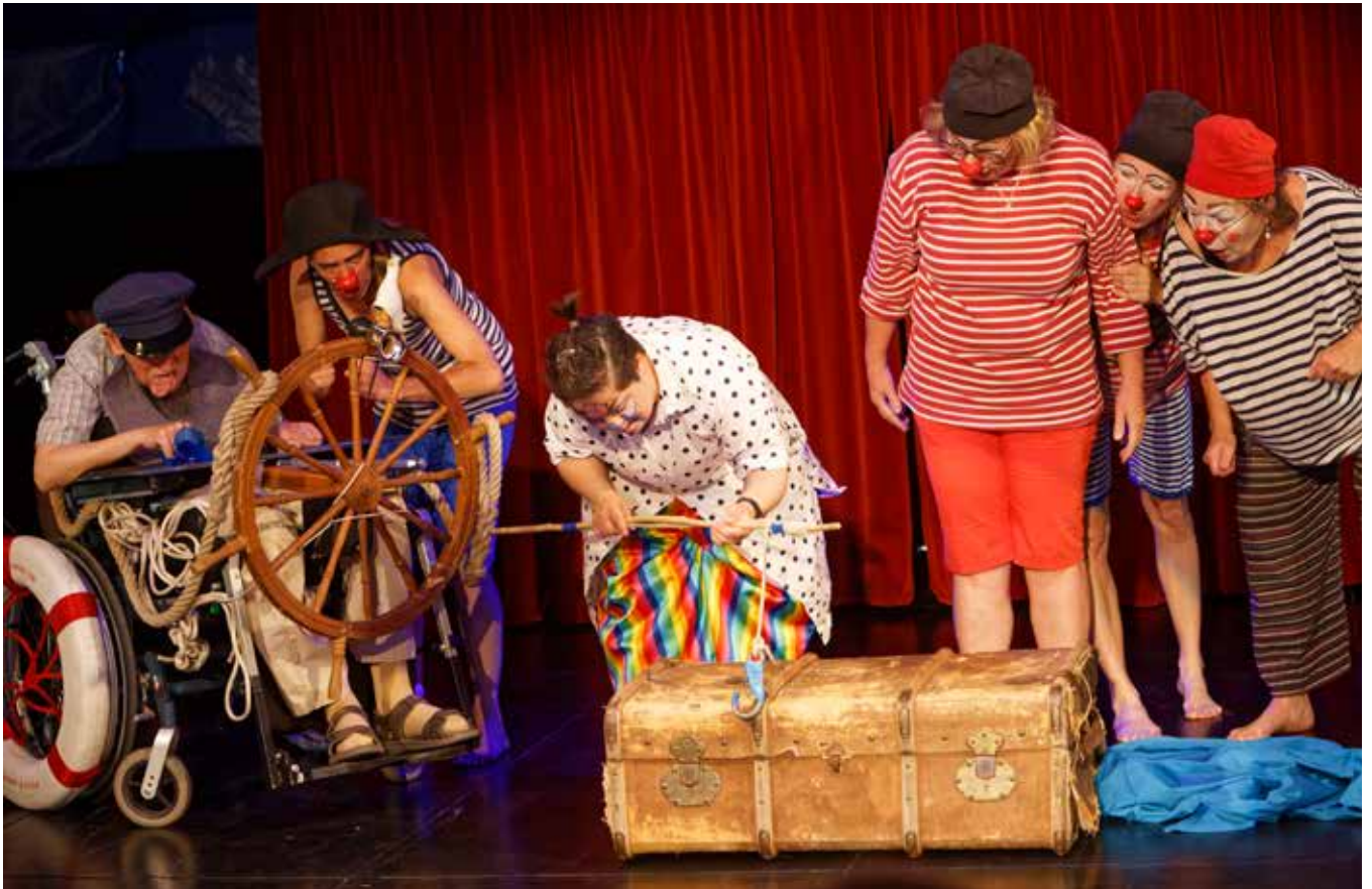
Die Clowngruppe bei ihrem Auftritt als Piraten auf der Schatzsuche.