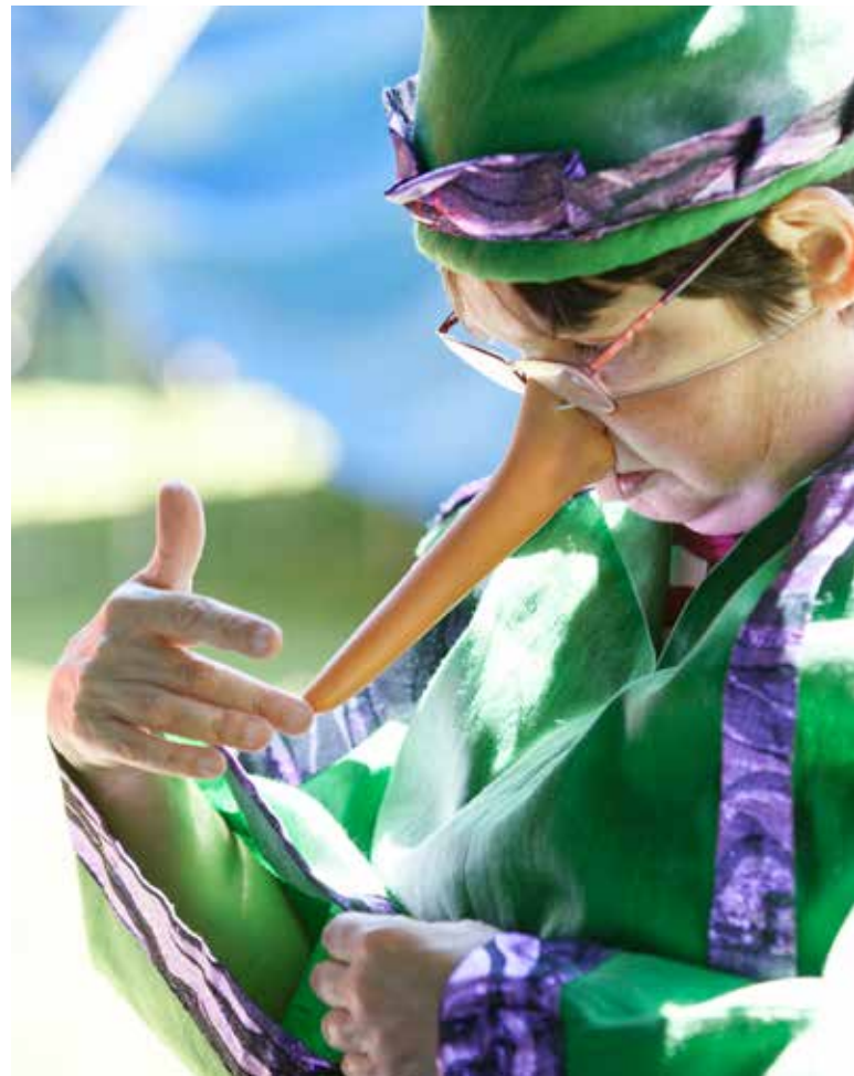
Die Bewohner:innen haben ihre Rolle gefunden.