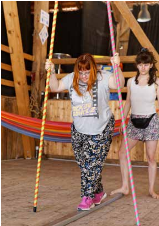
Die Bewohner:innen fanden sich schnell zurecht in ihrer Rolle als Artist:innen, grosse Konzentration war die ganze Woche gefordert.