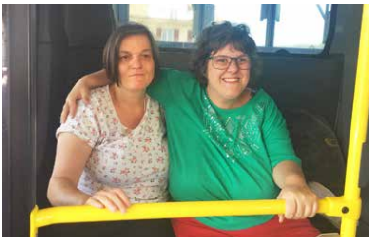
Leissigen war für die Wohngruppe 3 der ideale Ferienort.